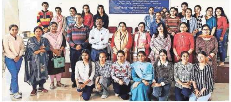
कार्यक्रम में उपस्थित छात्राएं व कॉलेज स्टाफ।

उन्होंने आज के परिदृश्य का वर्णन करते हुए कहा कि निजी उद्योग अपने कर्मचारियों को सरकारी क्षेत्रों की तुलना में अधिक मूल्यांकन प्रदान